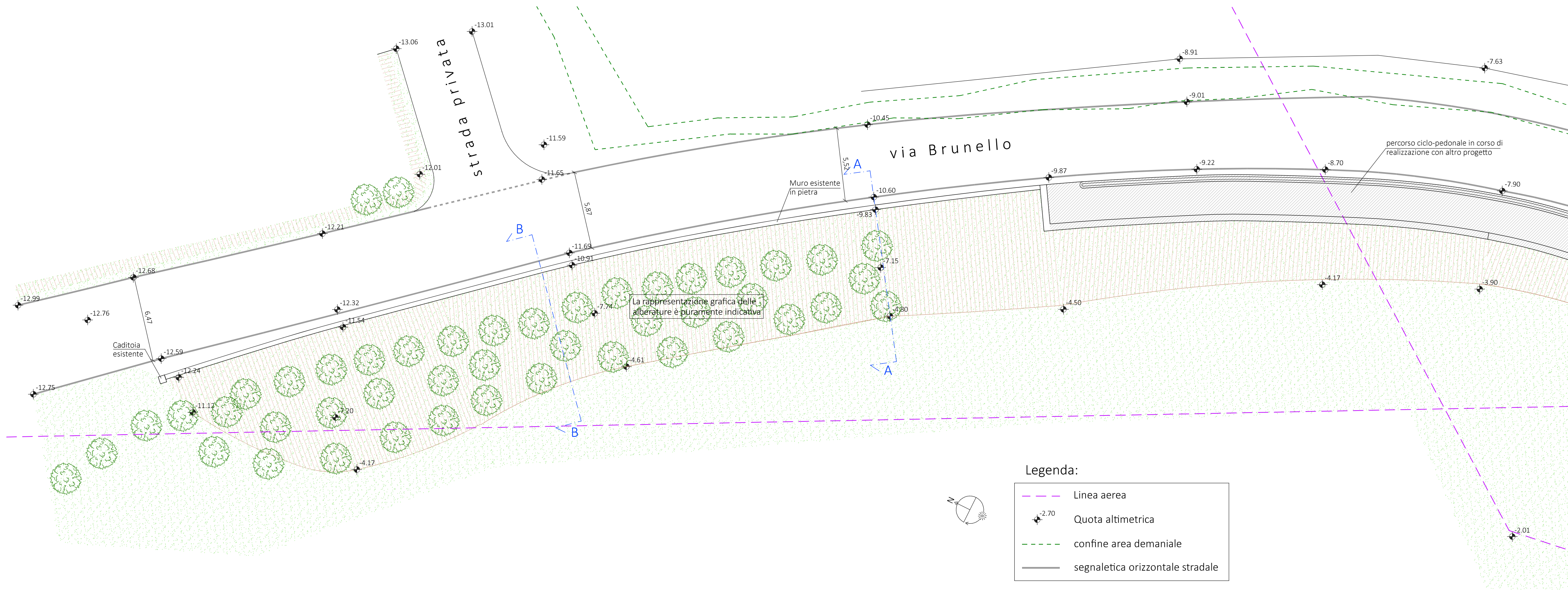
PLANIMETRIA QUOTATA Scala 1:200